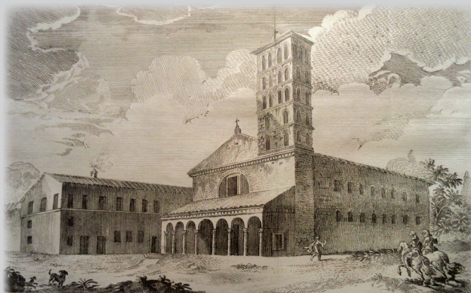
Orthographia antiquae Basilicae ac veteris Coenobii SS. Bonifacii, et Alexii de Vrbe in Colle Aventino