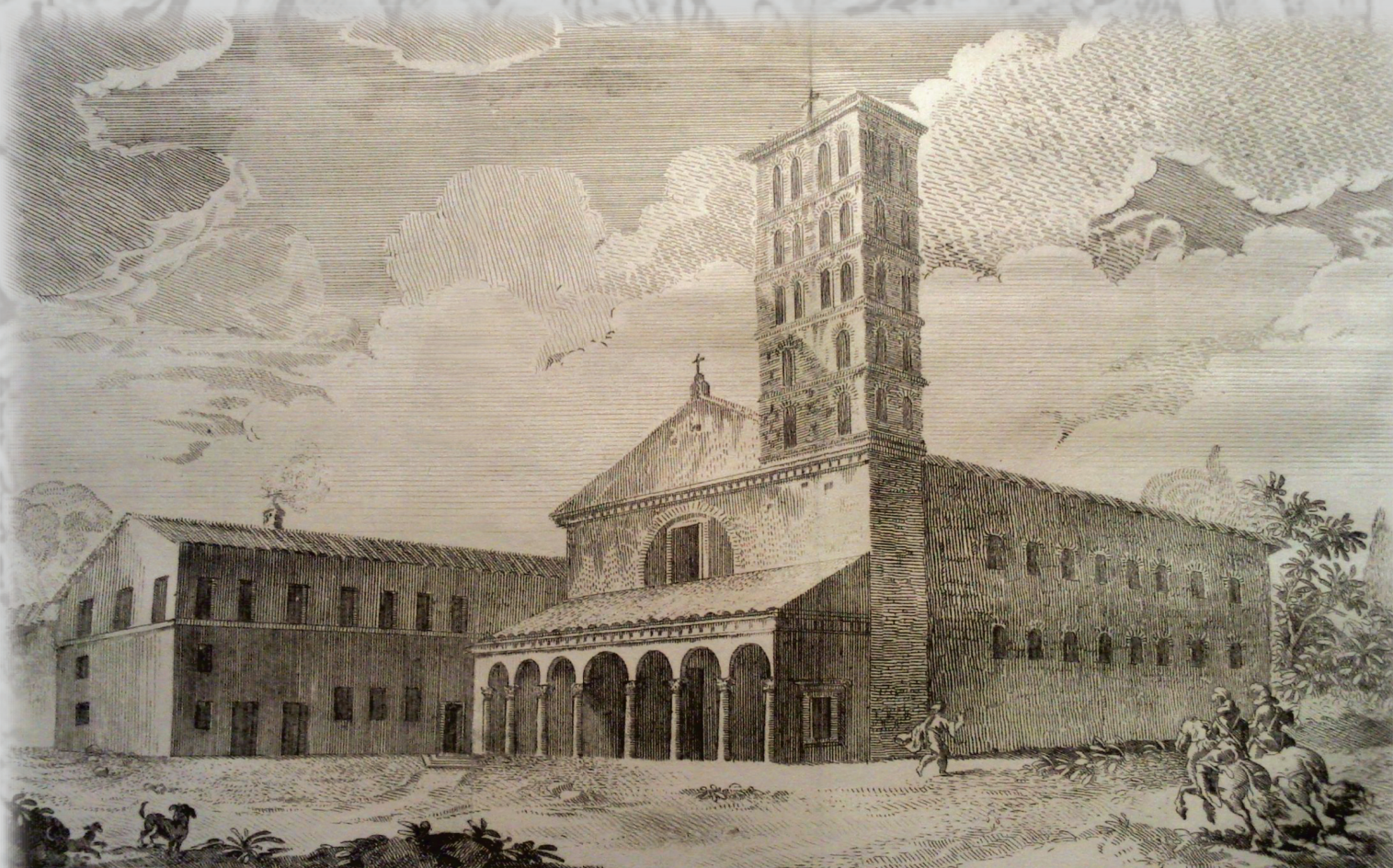
Orthographia antiquae Basilicae ac veteris Coenobii SS. Bonifacii, et Alexii de Vrbe in Colle Aventino