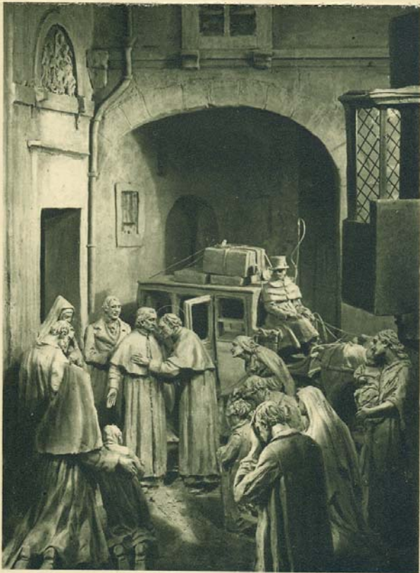
La partenza per Chieri. L'ultimo saluto. Départ pour Chieri. Dernier adieu.