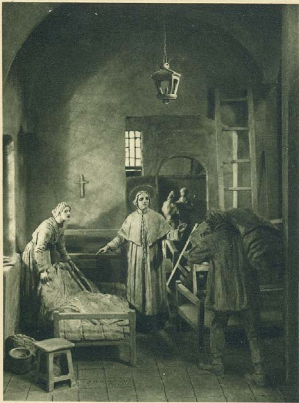
I primi quattro letti dell'Istituto della Divina Provvidenza.

Les quatre premiers lits à la Maison de la Divine Providence.