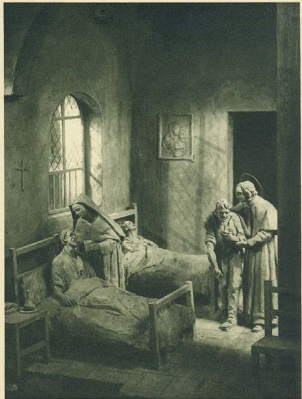
Un nuovo ospite all'Istituto della Divina Provvidenza.

Les quatre premiers lits à la Maison de la Divine Providence.