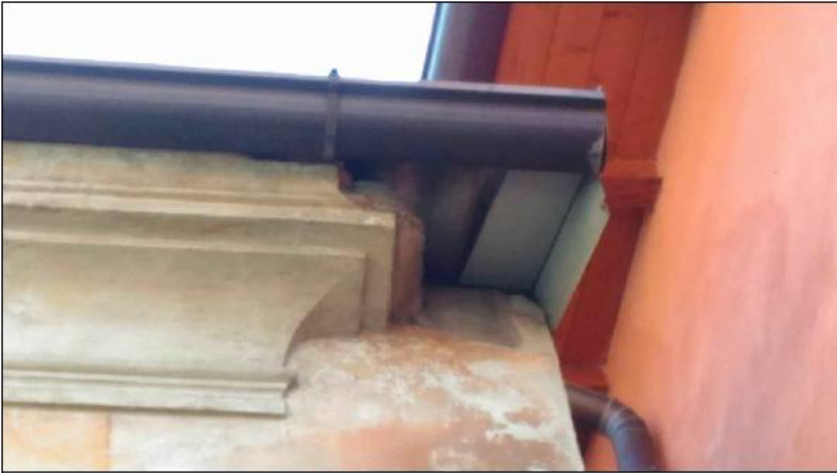
Foto 29: prospetto Ovest lungo via San Gerolamo - particolare del cornicione costituente sbalzo di gronda