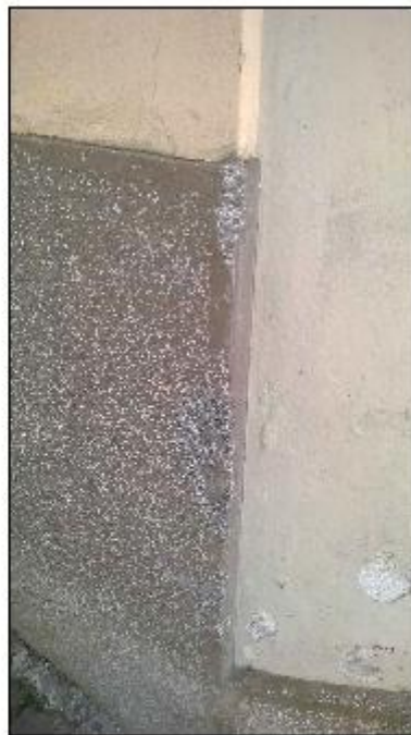
Foto 12: angolo Nord Est - dettaglio del degrado della zoccolatura e dell'intonaco di facciata