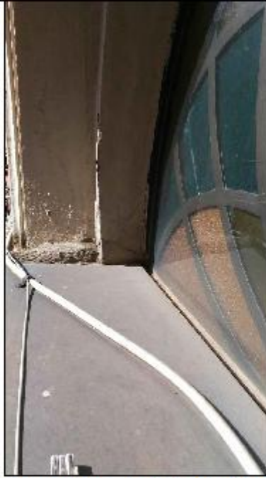
Foto 23: prospetto Est lungo via alla Basilica - dettaglio della copertina in rame inclinata verso il filo esterno del serramento a lunetta