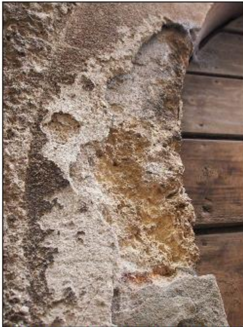
Foto 32: prospetto Ovest lungo via San Gerolamo - particolare del degrado degli intonaci all'intorno del portone d'accesso principale