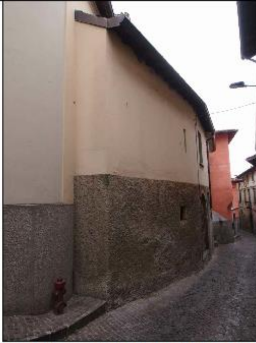
Foto 25: prospetto Ovest lungo via San Gerolamo verso l'angolo con piazzetta Madre degli Orfani