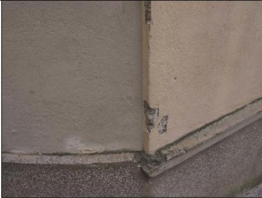
Foto 11:angolo Nord Ovest - dettaglio del degrado della zoccolatura e degli intonaci di facciata