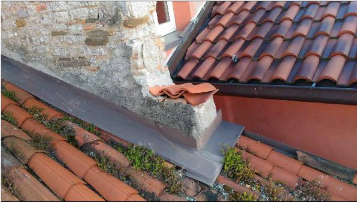
Foto 69: copertura - particolare del degrado del manto a copertura della stanza di San Girolamo in prossimità del muro emergente la linea della falda