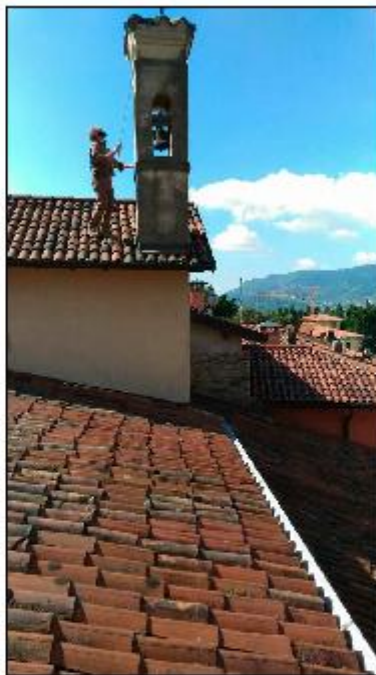
Foto 50: prospetto Nord - particolare del timpano e del campanile innestato sull'incrocio dei muri perimetrali del timpano