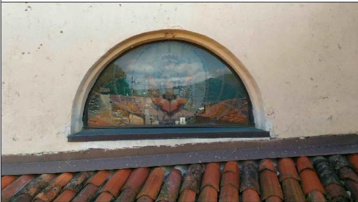
Foto 42: prospetto Ovest lungo via San Gerolamo - particolare del serramento a lunetta del timpano