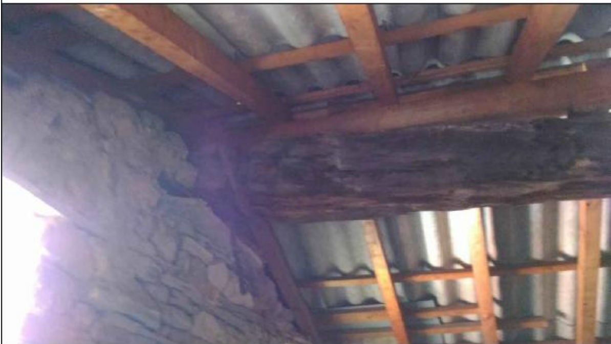
Foto F: sottotetto timpano - particolare innesto dell'orditura secondaria lungo la trave di colmo del sottocoppo in Etna