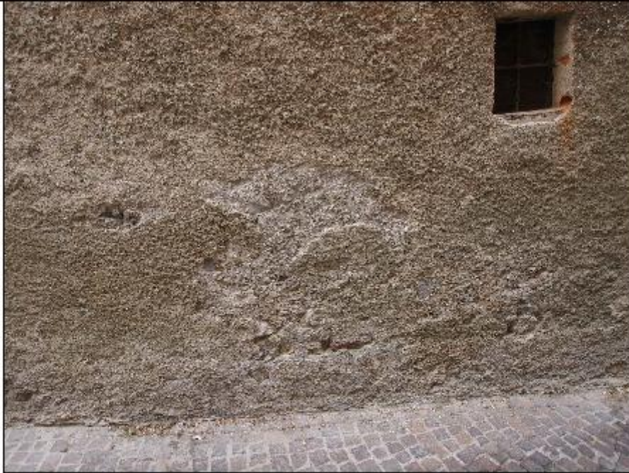
Foto 33: prospetto Ovest lungo via San Gerolamo - particolare del degrado della zoccolatura in intonaco di cemento lungo strada