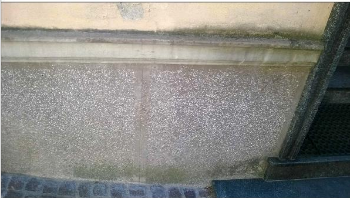
Foto 10: prospetto Nord - dettaglio del degrado della zoccolatura e dell'intonaco di facciata