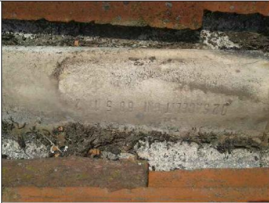
Foto 63: copertura - dettaglio della lastra di sottocoppo in Eternit risalente al 1988