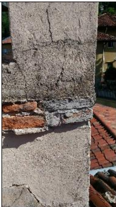
Foto 57: campanile prospetto Sud - particolare della lacuna lungo il cordolo perimetrale