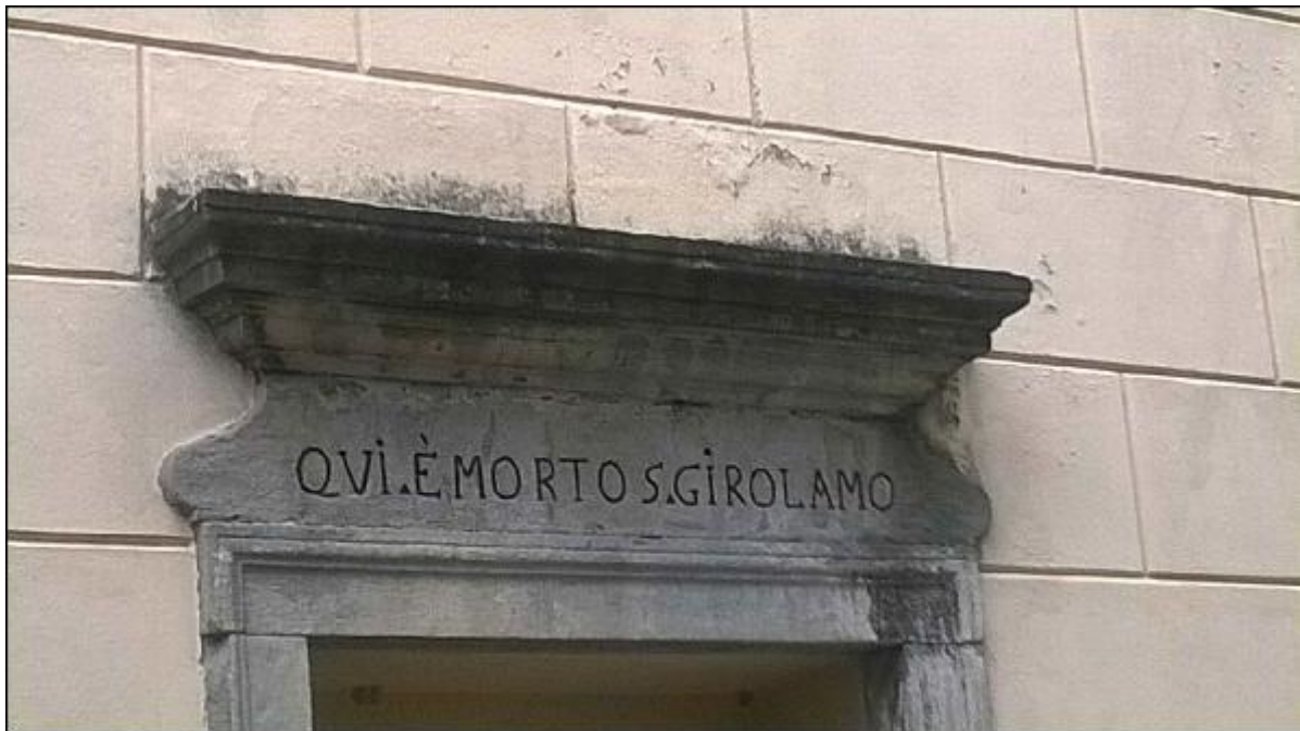
Foto 19: prospetto Est lungo via alla Basilica - particolare del degrado degli intonaci di facciata sopra il portale d'accesso