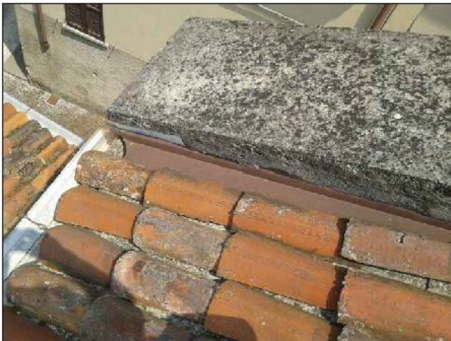
Foto 64: copertura - particolare della copertina del timpano Est in Ghiandone e degrado del sottostante manto di copertura