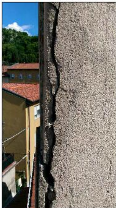
Foto 54: campanile prospetto Sud - particolare del degrado statico e degli intonaci di facciata