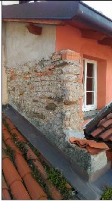
Foto 45: particolare del muro privo di intonaco e con considerevoli lacune in proseguio del muro verso il cavedio oltre la linea di falda a copertura della stanza di San Gerolamo