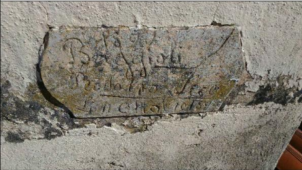
Foto 56: campanile prospetto Sud - particolare dell'iscrizione datata 1891 e 1899