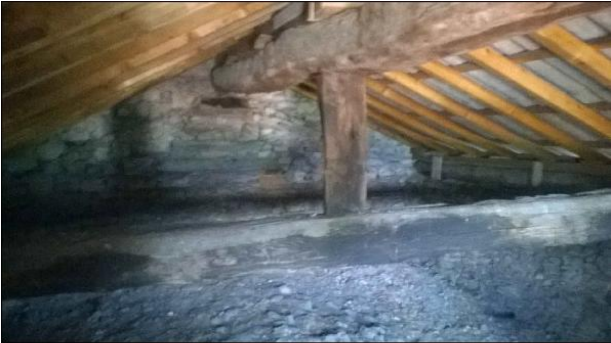
Foto G: sottotetto timpano - particolare innesto orditura secondaria sulla trave di colmo e di quest'ultima sulla trave centrale di mezzera