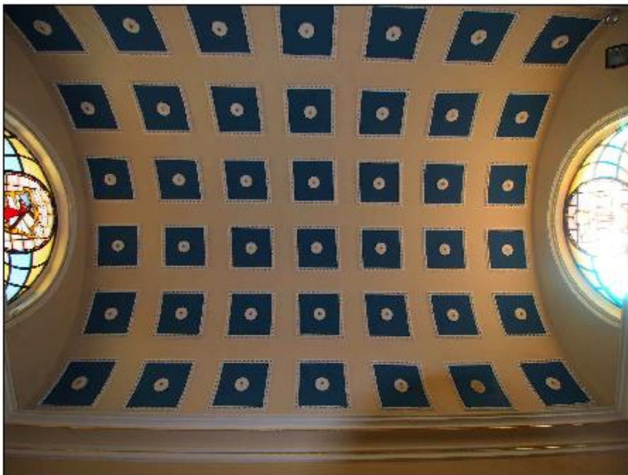
Foto 78: interno - dettaglio della volta a botte a copertura del presbiterio