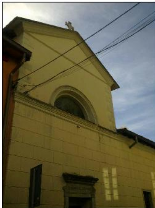
Foto 22: prospetto Est lungo via alla Basilica - particolare del timpano con serramento a lunetta