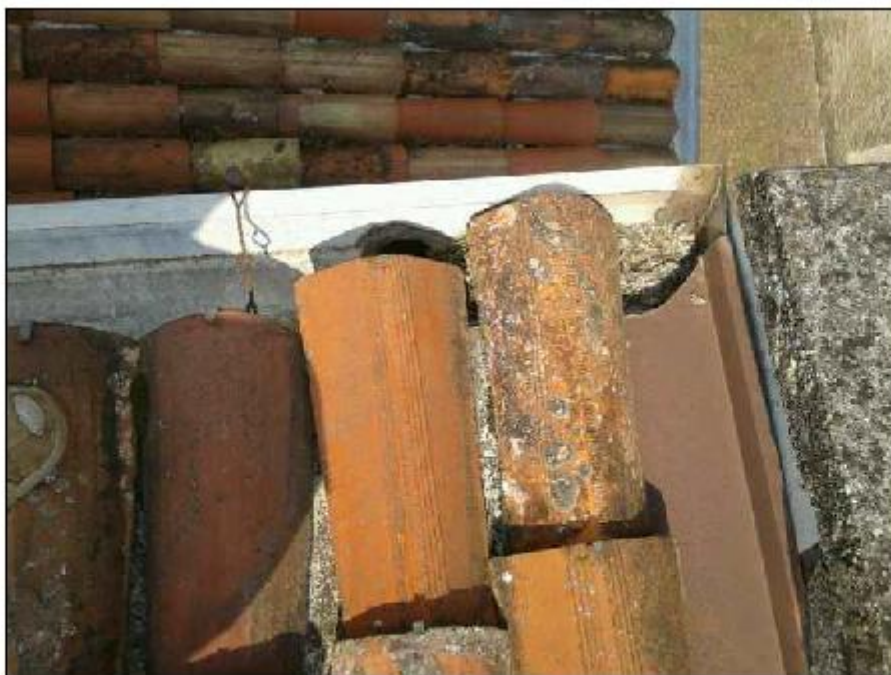
Foto 66: copertura -particolare della copertina del timpano Est in Ghiandone e degrado del sottostante manto di copertura e del canale di gronda in alluminio