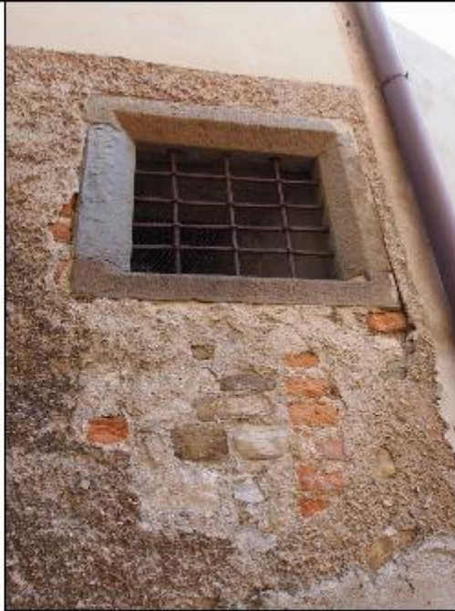
Foto 31: prospetto Ovest lungo via San Gerolamo - particolare del degrado della zoccolatura sotto finestra esistente