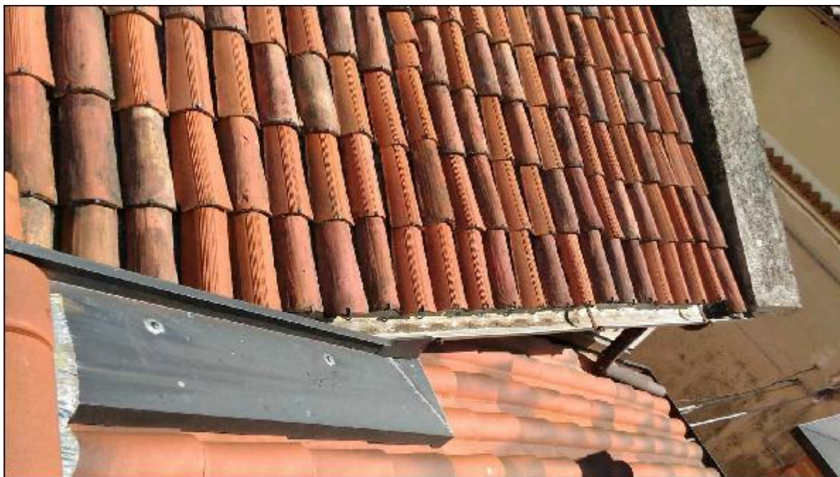
Foto 67: copertura - particolare dell'innesto tra la falda Sud del timpano e le falde a copertura del limitrofo complesso oggetto di recente ristrutturazione