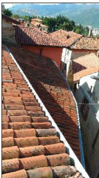
Foto 68: copertura - particolare della falda a copertura Est a copertura della Mater Orphanorum e relativo canale di gronda in alluminio