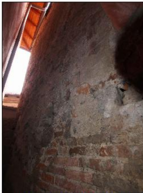
Foto 36: muro in affaccio su cavedio - particolare della muratura mista a vista con presenza di importanti lacune