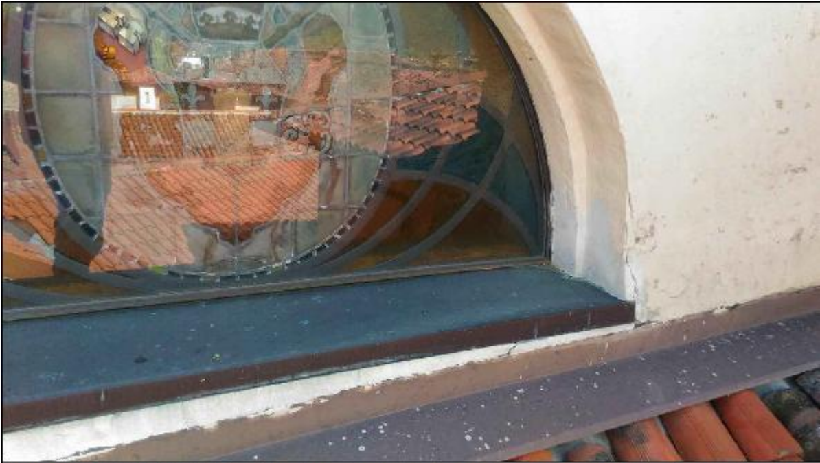
Foto 43: prospetto Ovest - particolare del serramento a lunetta del timpano e della sottostante copertina in rame e copertura