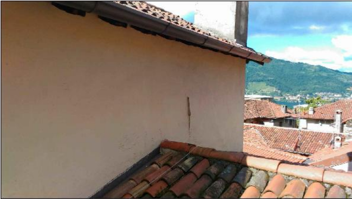
Foto 47: prospetto Nord del timpano - particolare dell'innesto tra la linea di colmo delle falde a copertura della Mater Orphanorum con la linea di gronda della falda a copertura del timpano