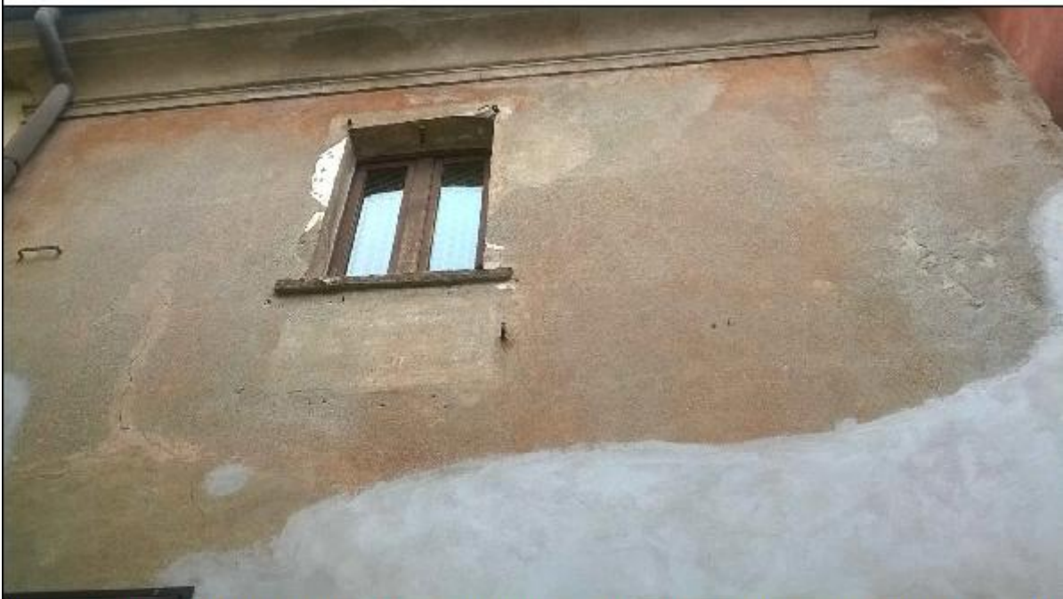
Foto 28: prospetto Ovest lungo via San Gerolamo - particolare dell'alterazione cromatica degli intonaci di facciata