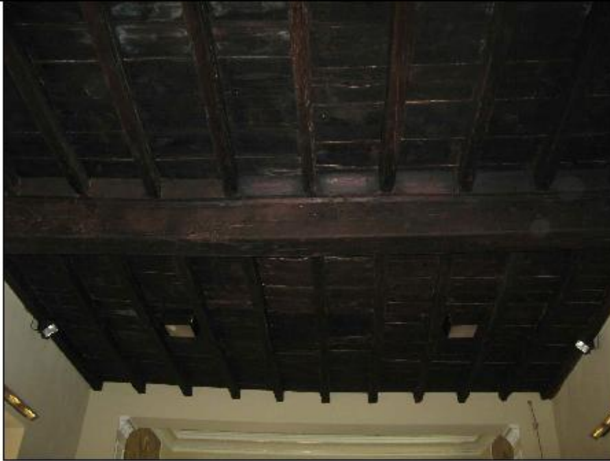
Foto 77: interno - dettaglio della copertura lignea sopra l'aula di preghiera