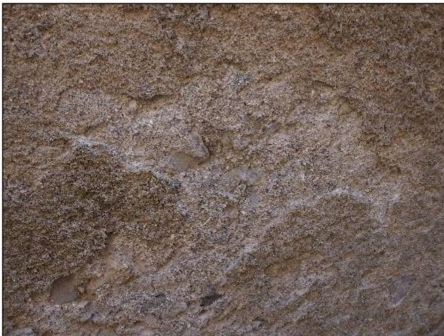
Foto 34: prospetto Ovest lungo via San Gerolamo - particolare del degrado della zoccolatura in intonaco di cemento lungo strada