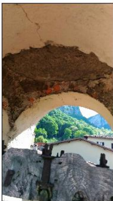
Foto 60: campanile - particolare del degrado degli intonaci della cella campanaria e del voltino di copertura