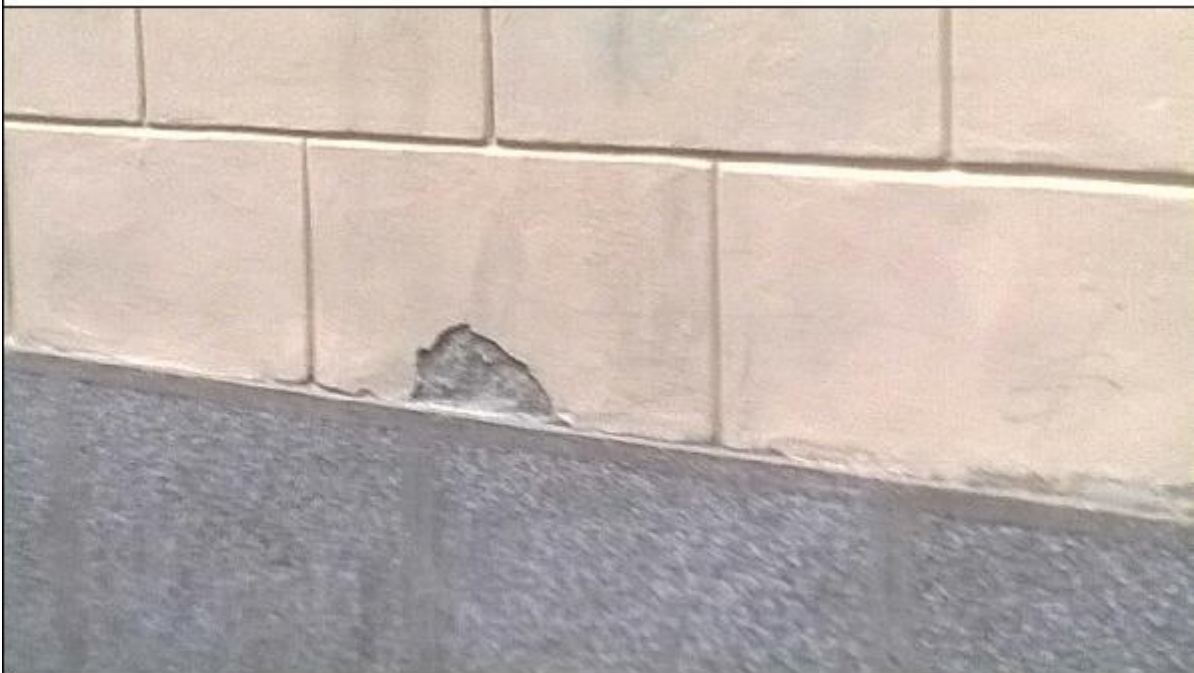
Foto 16: prospetto Est lungo via alla Basilica - particolare del degrado degli intonaci di facciata