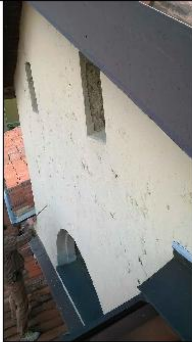
Foto 39: prospetto Ovest lungo via San Gerolamo - particolare del timpano con serramento a lunetta e due aperture soprastanti