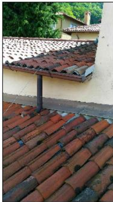
Foto 44: prospetto Ovest lungo via San Gerolamo - particolare dell'innesto delle falde tra il corpo più basso lungo via San Gerolamo e la linea di gronda delle falde a copertura della Mater Orphanorum