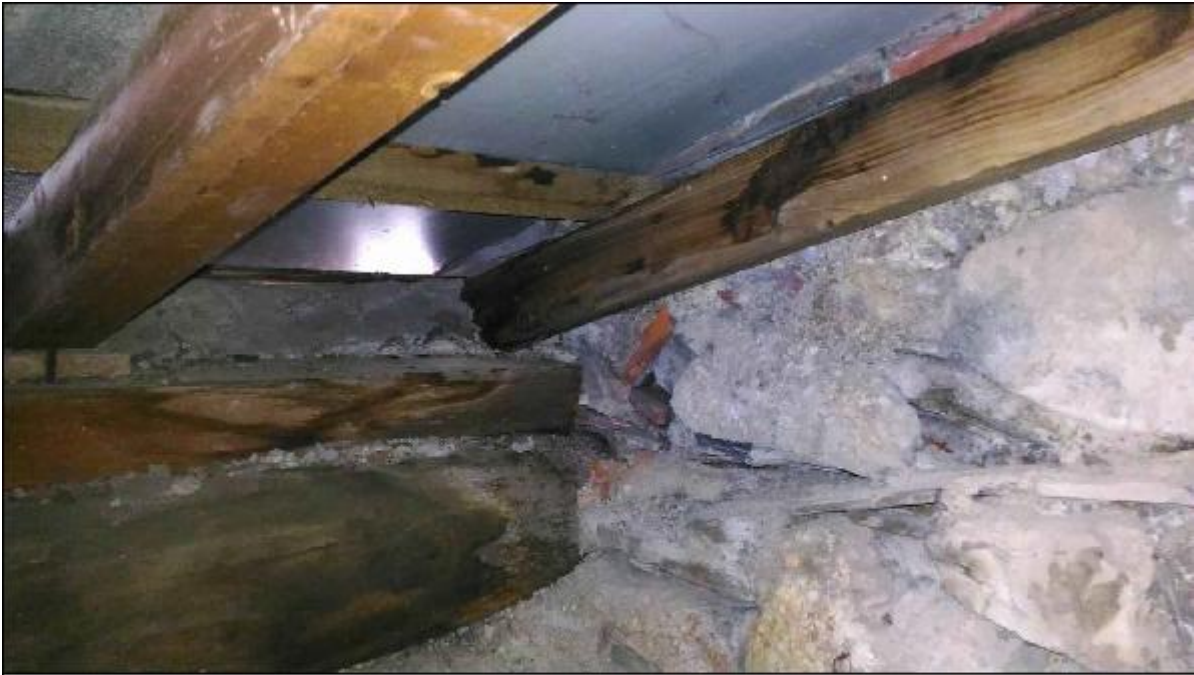
Foto A: sottotetto timpano - particolare innesto travetto di testata lungo muro perimetrale