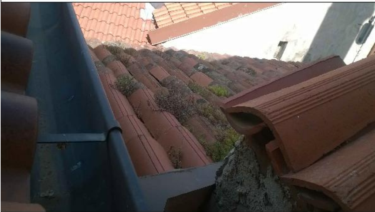
Foto 70: copertura - particolare della vegetazione spontanea sul manto a copertura della stanza di San Girolamo in prossimità del muro emergente la linea della falda