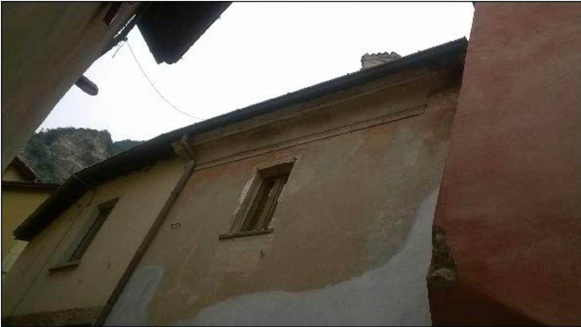
Foto 27: prospetto Ovest lungo via San Gerolamo - particolare del degrado degli intonaci di facciata