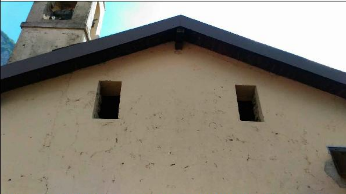
Foto 40: prospetto Ovest lungo via San Gerolamo - particolare dell'avanzato stato di degrado degli intonaci di facciata del timpano