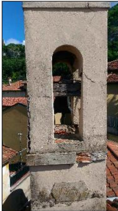
Foto 52: campanile prospetto Sud - particolare del degrado statico e degli intonaci di facciata