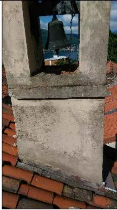
Foto 51: campanile prospetto Est - particolare del degrado degli intonaci di facciata