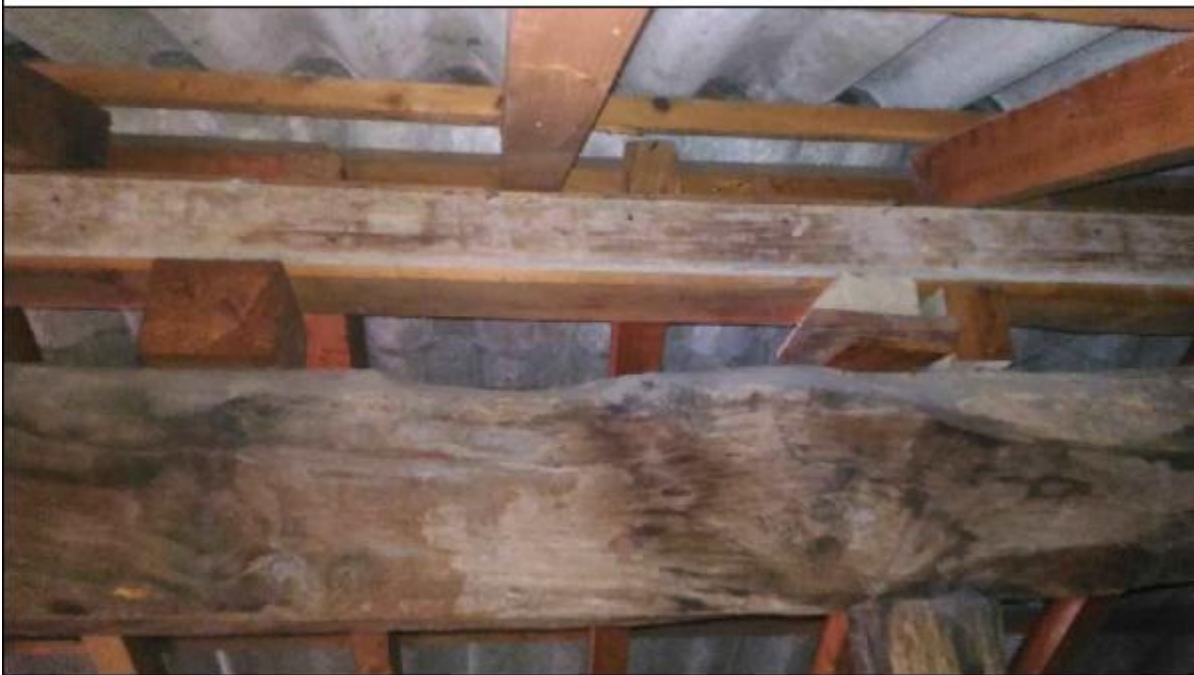
Foto B: sottotetto timpano - particolare innesto dell'orditura secondaria lungo la trave di colmo