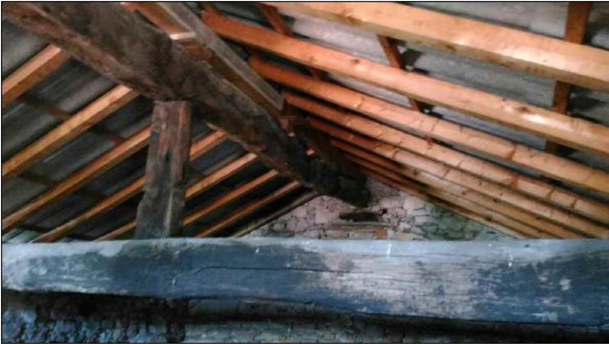
Foto C: sottotetto timpano - particolare innesto orditura secondaria sulla trave di colmo e di quest'ultima sulla trave centrale di mezzeria