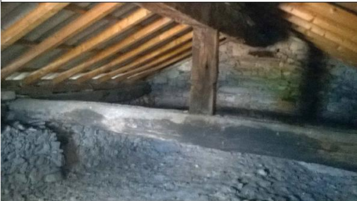
Foto H: sottotetto timpano - particolare innesto orditura secondaria sulla trave di colmo e di quest'ultima sulla trave centrale di mezzera