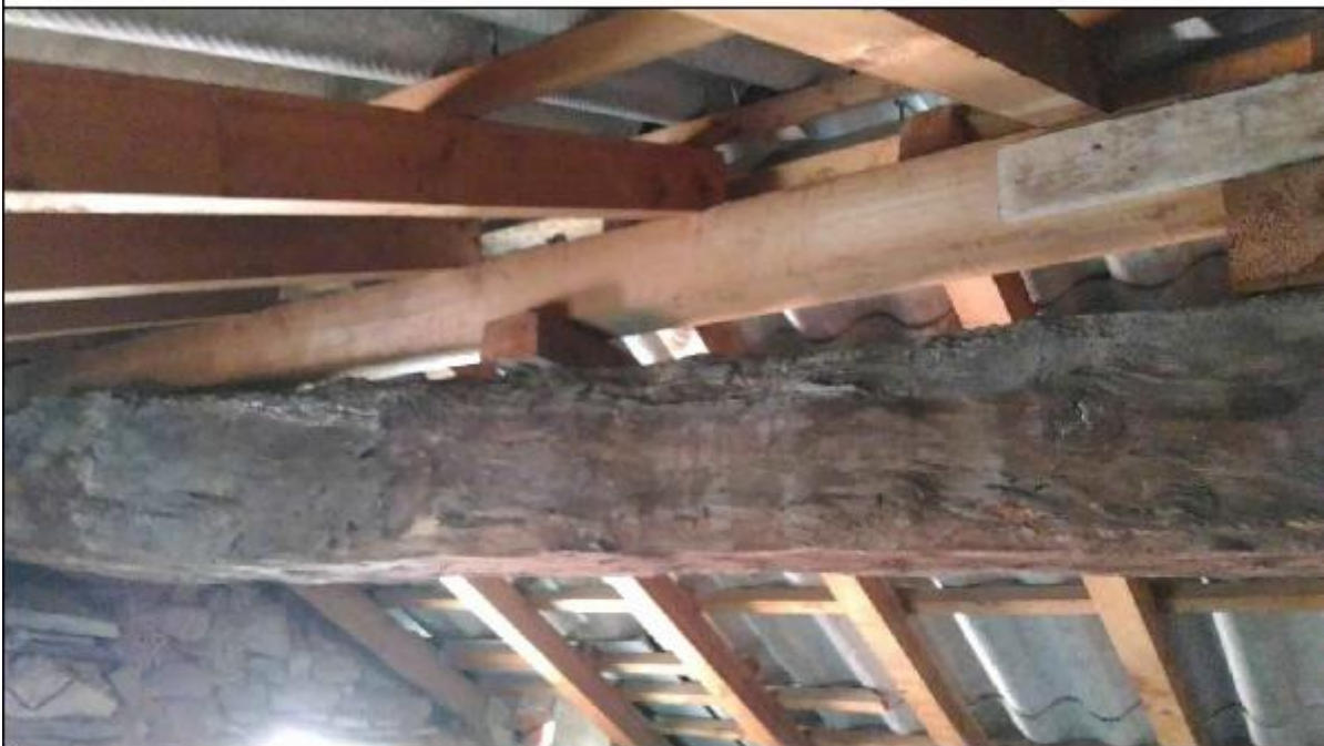
Foto D: sottotetto timpano - particolare innesto dell'orditura secondaria lungo la trave di colmo