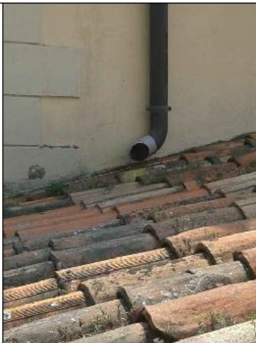
Foto 65: copertura - particolare dei coppi costituenti la falda a copertura della Mater Orphanorum e del pluviale in alluminio a servizio della falda Nord del timpano