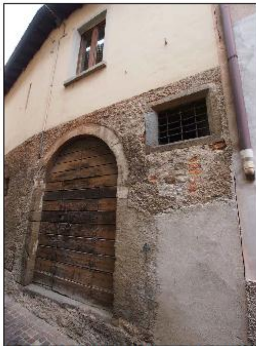
Foto 30: prospetto Ovest lungo via San Gerolamo - particolare del portone d'accesso e del degrado della zoccolatura lungo strada