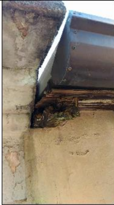
Foto 49: prospetto Nord - particolare del degrado degli intonaci di facciata del timpano e di alcuni travetti dell'orditura esistente