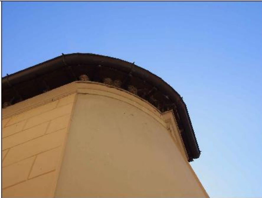
Foto 73: copertura - particolare dei travetti e del fascione costituenti lo sbalzo di gronda in corrispondenza dell'angolo Nord-Est