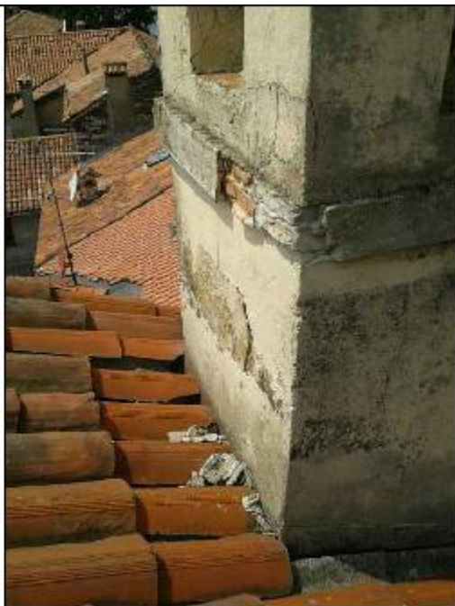
Foto 59: campanile angolo Sud-Est - particolare del degrado degli intonaci di facciata e della lacuna lungo il cordolo perimetrale