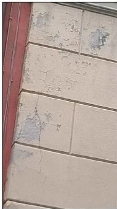
Foto 18: prospetto Est lungo via alla Basilica - particolare del degrado degli intonaci di facciata