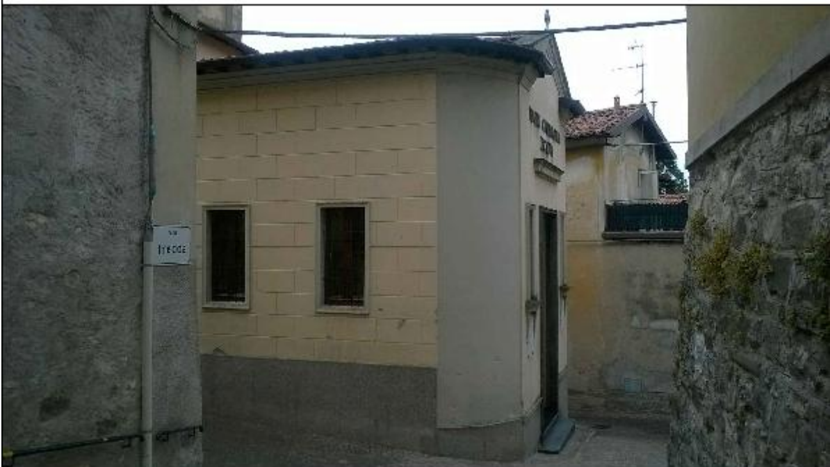
Foto 14: prospetto Est lungo via alla Basilica- dettaglio di facciata