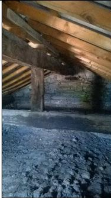
Foto I: sottotetto timpano - particolare innesto orditura secondaria sulla trave di colmo e di quest'ultima sulla trave centrale di mezzeria