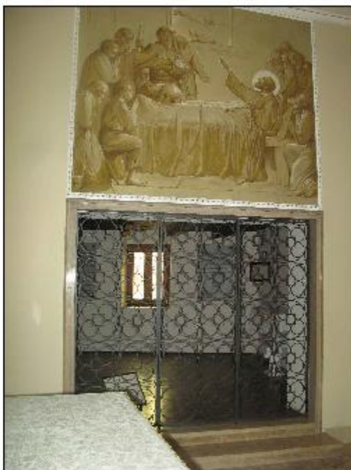
Foto 80: interno - dettaglio del prospetto Ovest del presbiterio aperto verso la stanza di San Girolamo