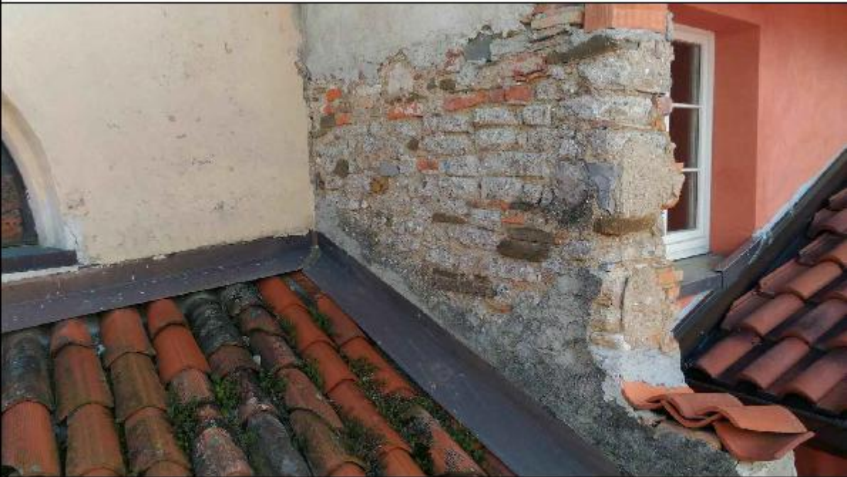
Foto 46: particolare del muro privo di intonaco e con considerevoli lacune in proseguio del muro verso il cavedio oltre la linea di falda a copertura della stanza di San Gerolamo