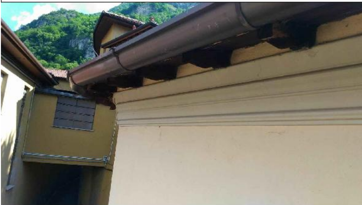
Foto 74: copertura - particolare dei travetti e del cornicione costituenti lo sbalzo di gronda e canale di gronda in alluminio