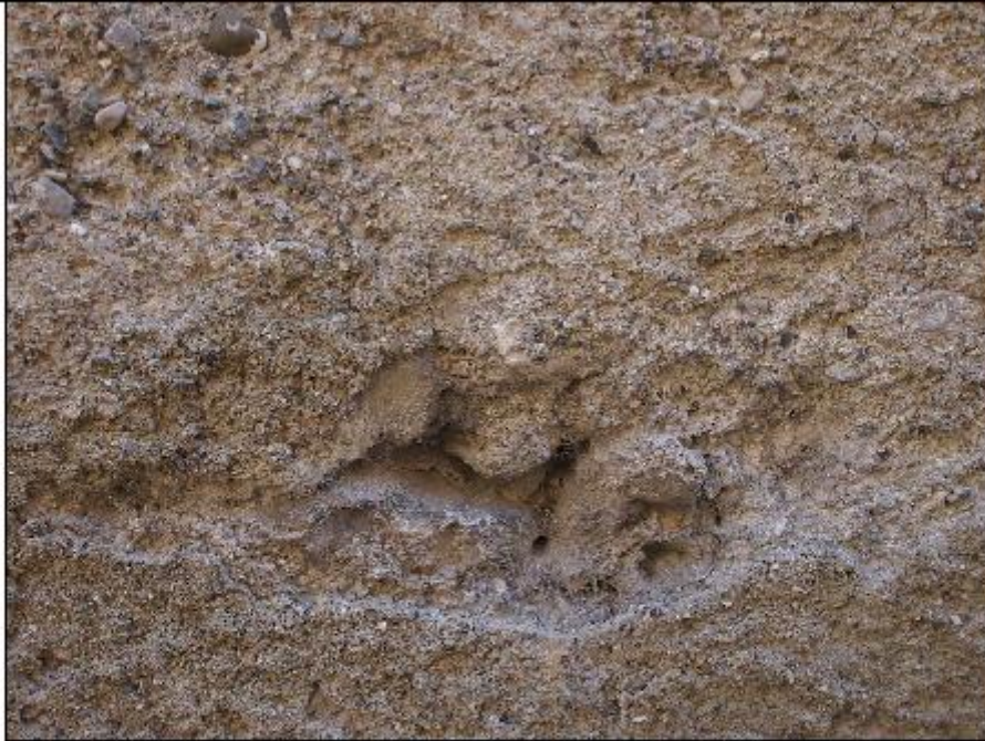
Foto 35: prospetto Ovest lungo via San Gerolamo - particolare del degrado della zoccolatura in intonaco di cemento lungo strada