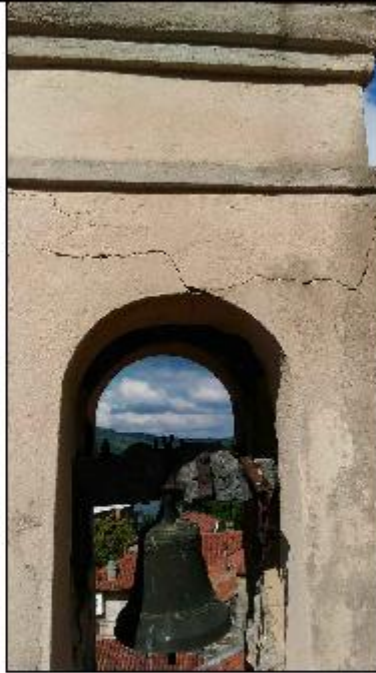
Foto 53: campanile prospetto Est - particolare del degrado statico e degli intonaci di facciata della cella campanaria