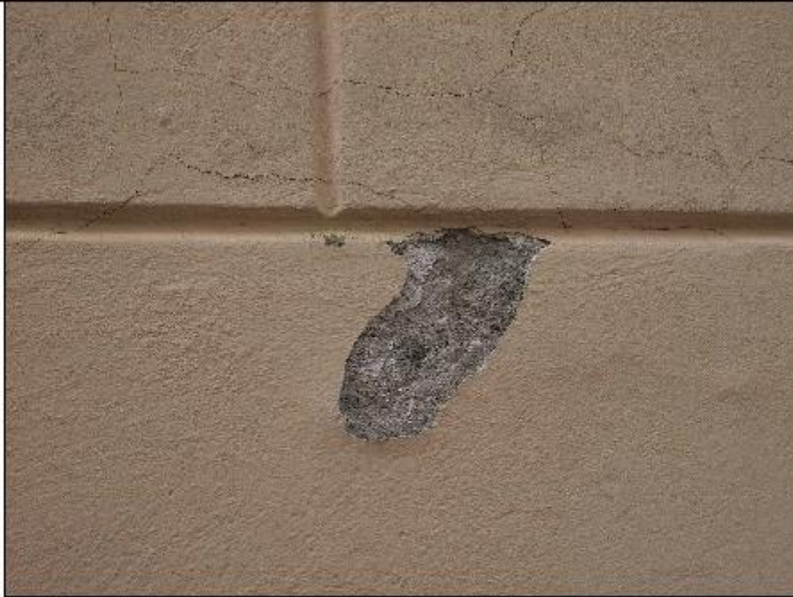
Foto 21: prospetto Est lungo via alla Basilica - particolare del degrado degli intonaci di facciata