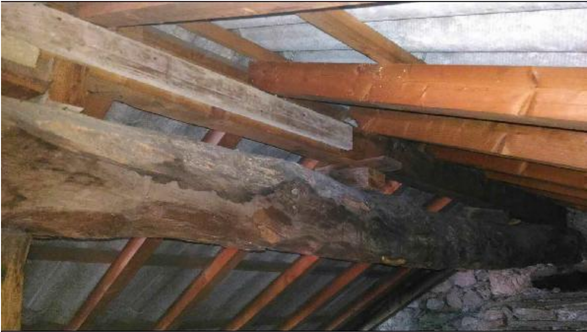
Foto E: sottotetto timpano - particolare innesto dell'orditura secondaria lungo la trave di colmo del sottocoppo in Etna