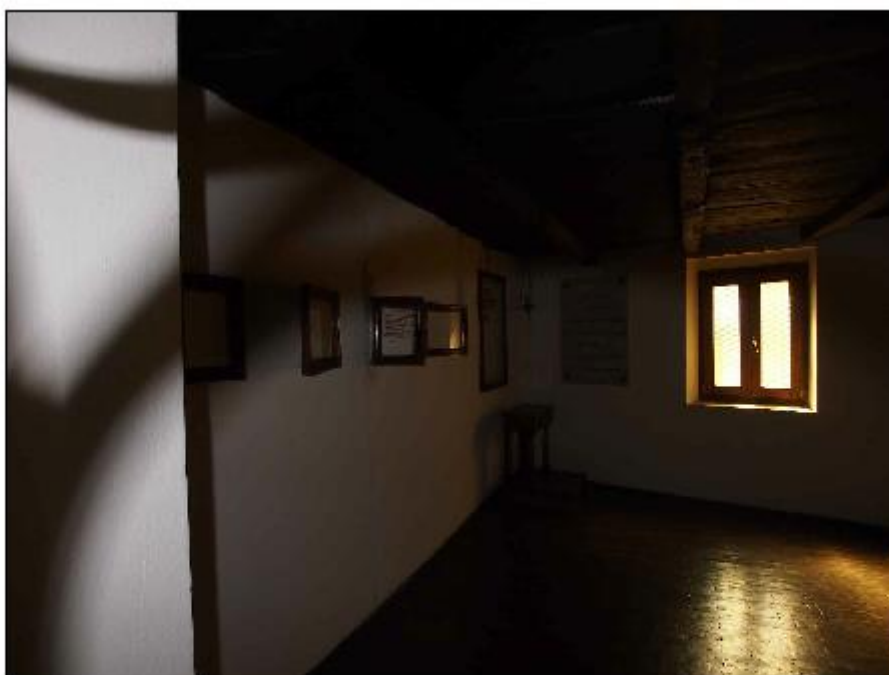
Foto 82: interno - particolare delle infiltrazioni lungo la parete Sud della stanza di San Girolamo