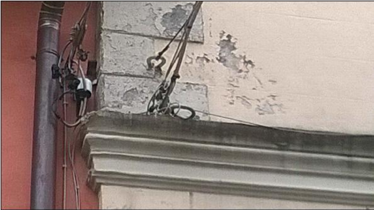
Foto 17: prospetto Est lungo via alla Basilica - particolare del degrado degli intonaci di facciata