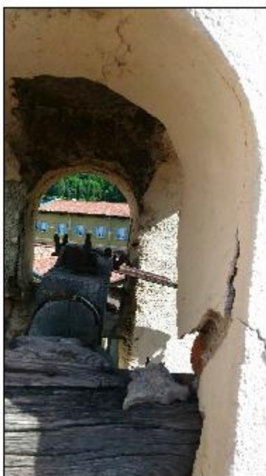
Foto 58: campanile - particolare del degrado degli intonaci della cella campanaria