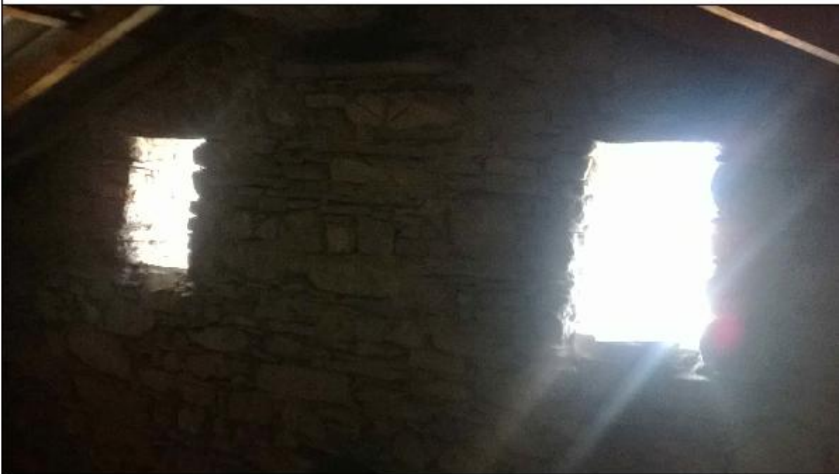
Foto J: sottotetto timpano - particolare delle due aperture ricavate sulla facciata Ovest del timpano