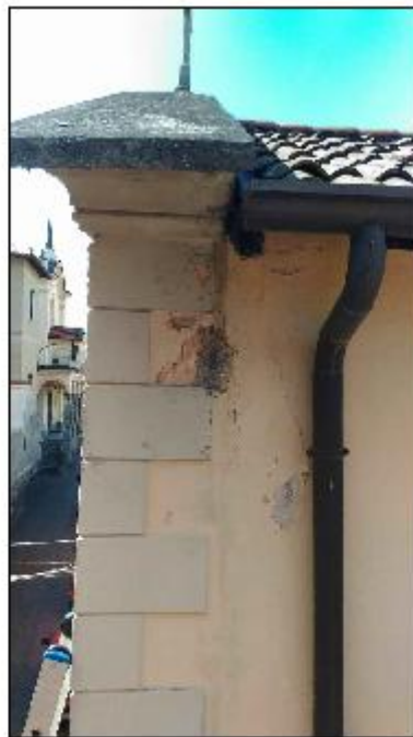
Foto 48: prospetto Nord - particolare del degrado degli intonaci di facciata del timpano e di alcuni travetti dell'orditura esistente