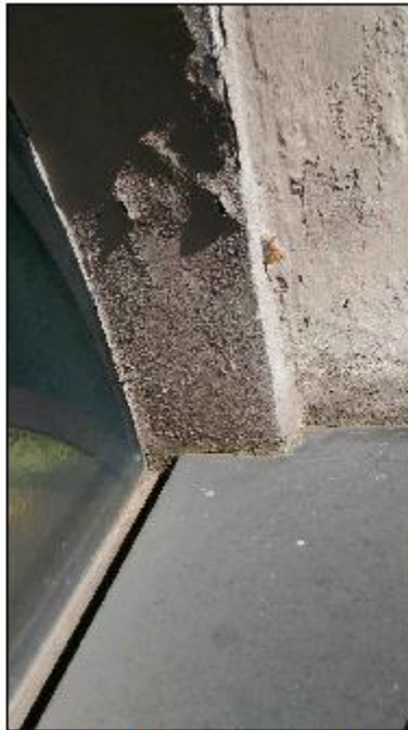
Foto 24: prospetto Est lungo via alla Basilica - dettaglio della copertina in rame inclinata verso il filo esterno del serramento a lunetta e degrado del cornicione ad arco