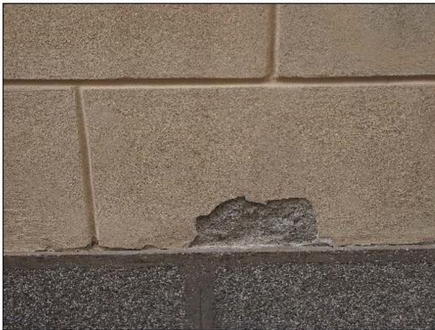
Foto 20: prospetto Est lungo via alla Basilica - particolare del degrado degli intonaci di facciata