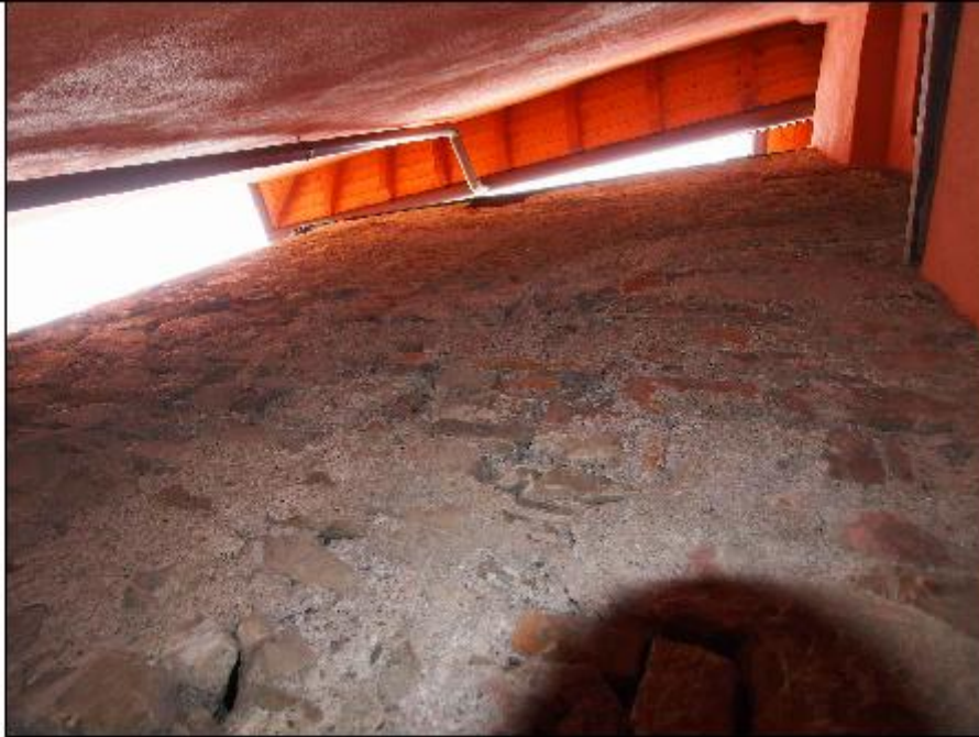
Foto 37: muro in affaccio su cavedio - particolare della muratura mista a vista con presenza di importanti lacune