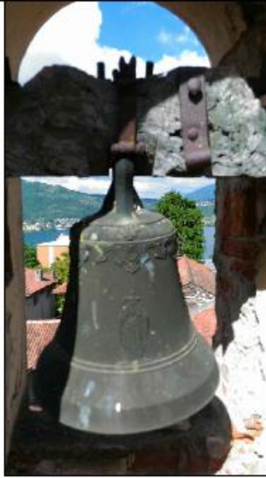
Foto 55: campanile - particolare del degrado dei legni a sostegno della campana