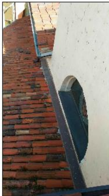
Foto 72: copertura - particolare dell'innesto tra i manti di copertura ed il prospetto Ovest del timpano