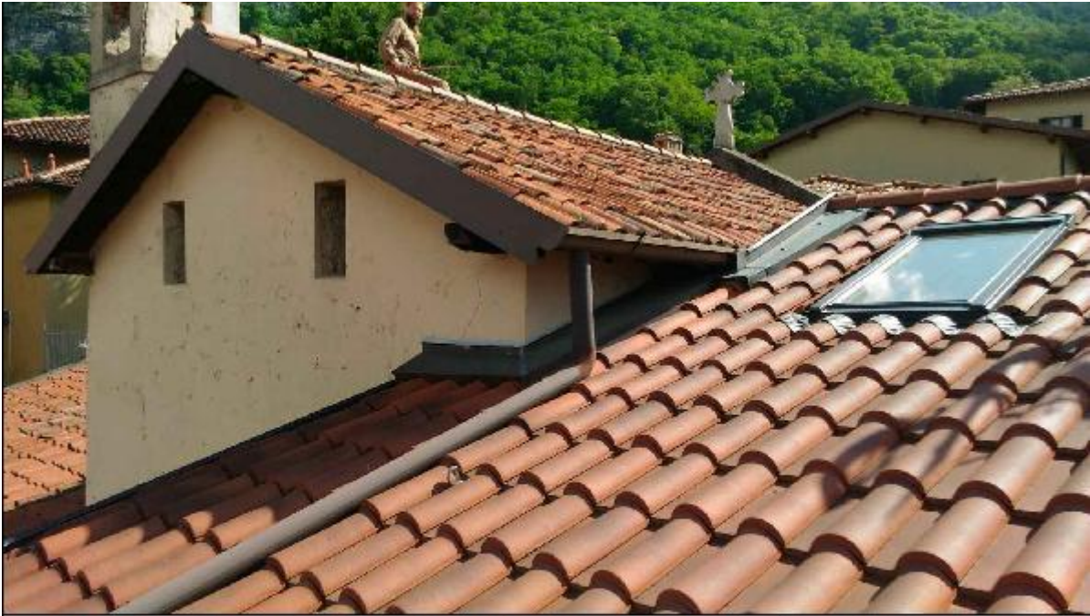
Foto 41: prospetto Ovest - particolare della facciata e della copertura del timpano e della continuità con l'edificio confinante di recente ristrutturazione