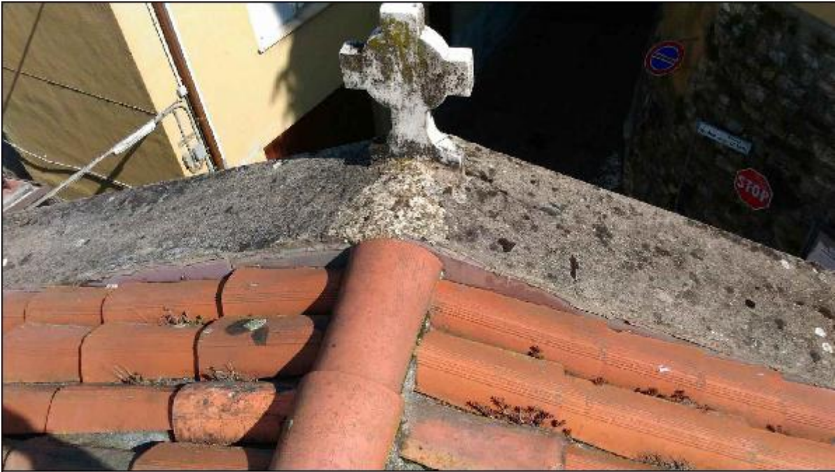
Foto 71: copertura - particolare dell'innesto tra la copertina in Ghiandone a copertura del timpano della facciata Nord e la linea di colmo del manto a copertura della Mater Orphanorum