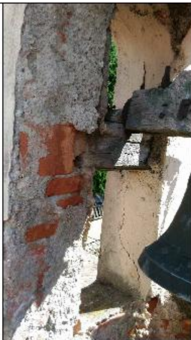
Foto 61: campanile - particolare del degrado degli intonaci della cella campanaria