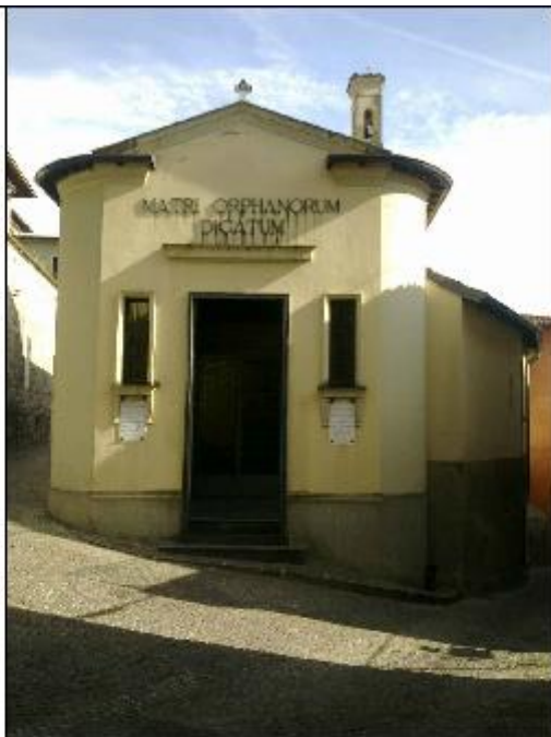
Foto 5: prospetto Nord affaccio sulla piazzetta Madre degli Orfani