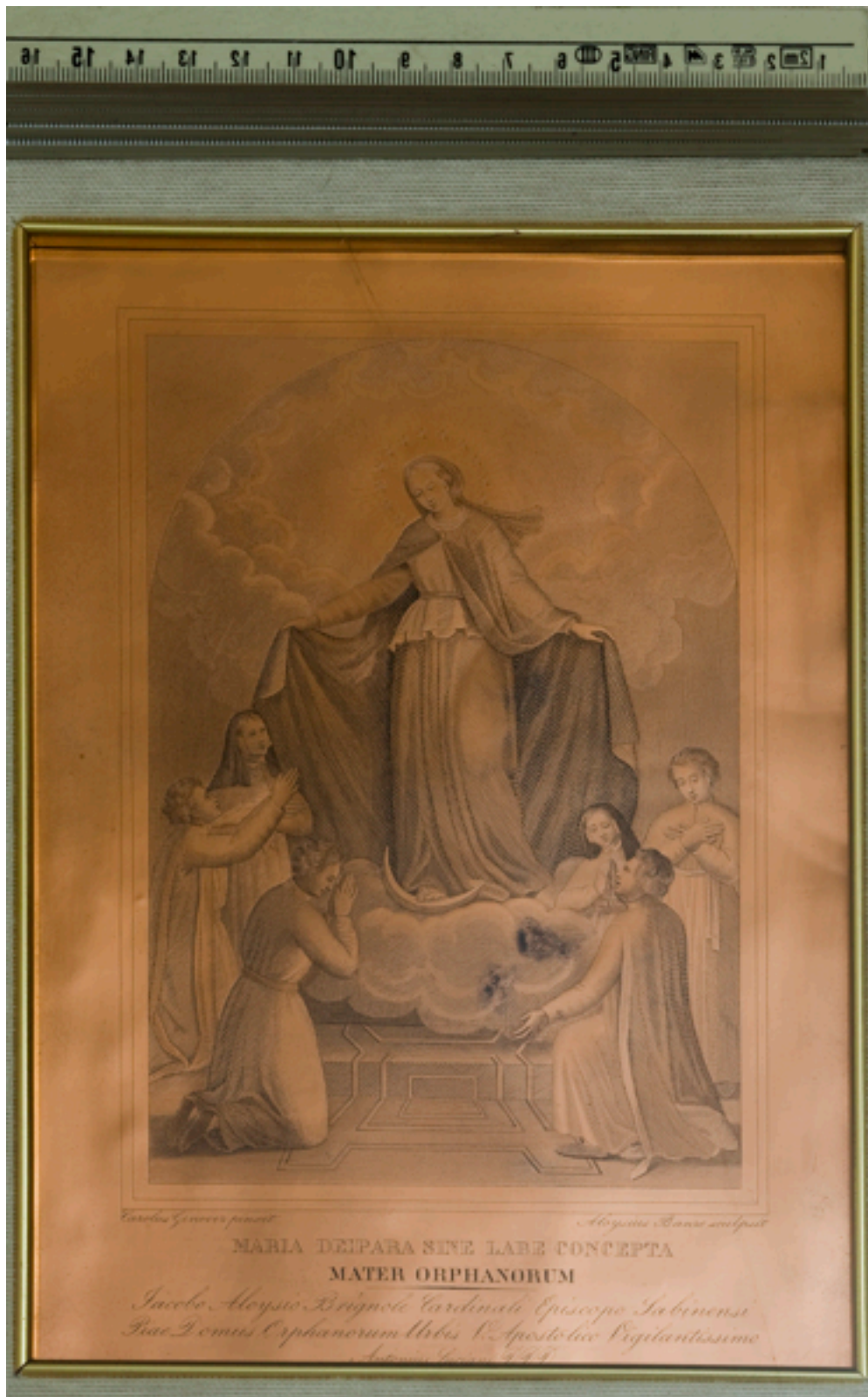
Rame conservato presso la casa di Albano Laziale (foto capovolta)