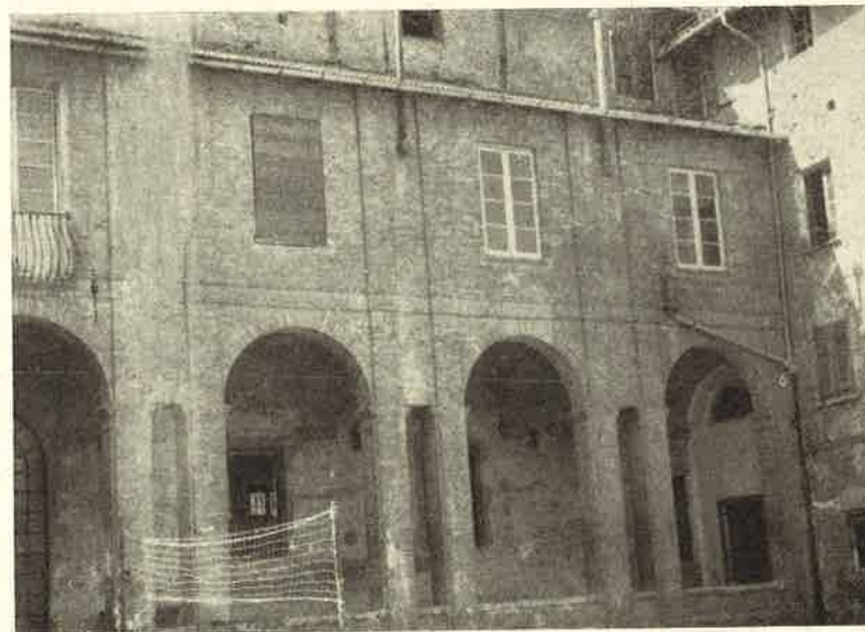
Novi: Collegio S. Giorgio. - Un lato dell'antico interno del Collegio.

Le scuole private e congregazioniste, come quella novese vengono soppresse, meglio passano alla dipendenza dello Stato, e ciò specialmente nei capoluoghi, oppure alla dipendenza dei Comuni costituendo le scuole « pareggiate », le quali debbono uniformarsi ai programmi della scuola statale restando sotto la sorveglianza dello Stato stesso.