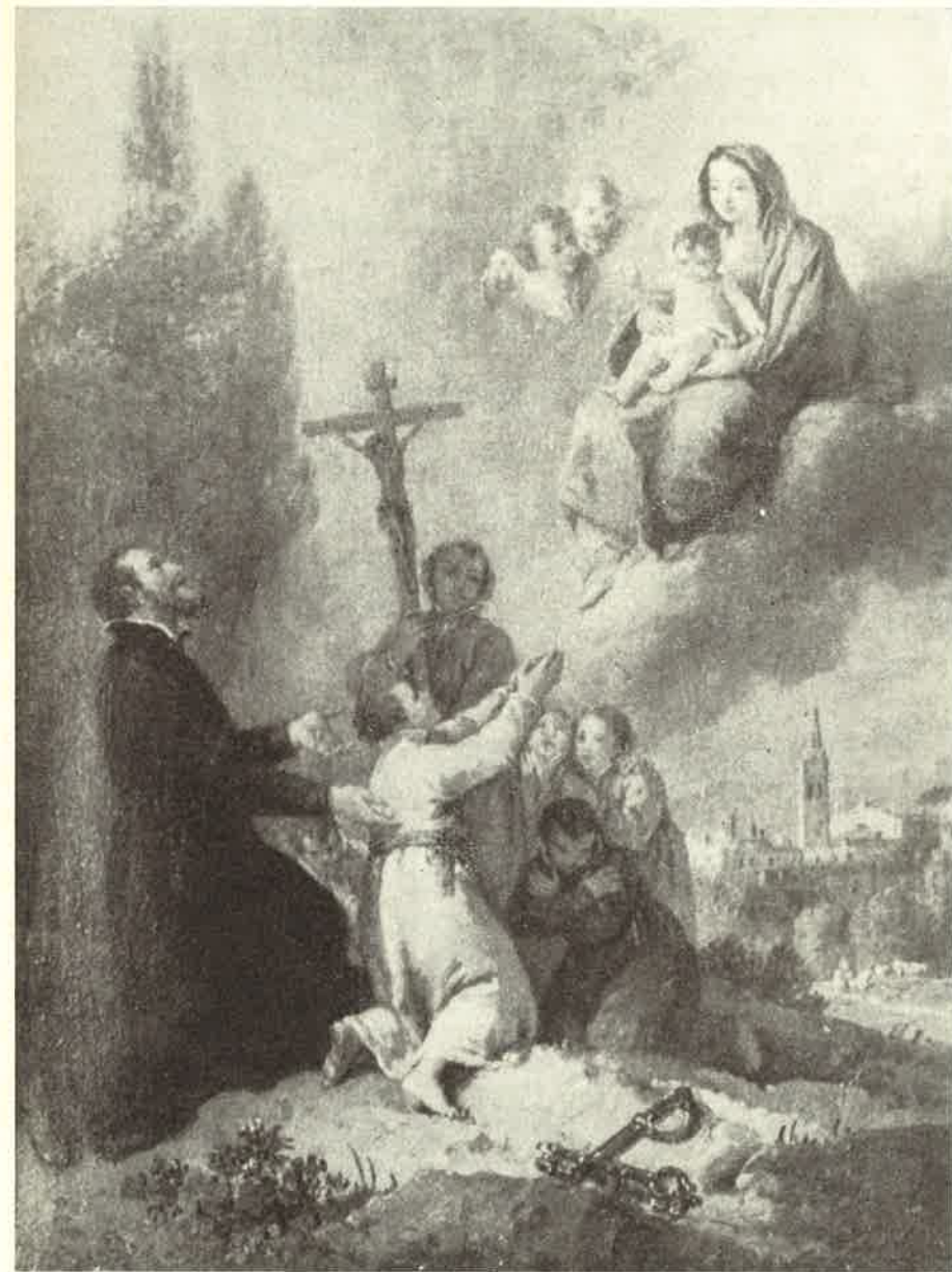
Zuccarelli Francesco. - Quadro di S. Girolamo Emiliani già nel collegio S. Bartolomeo di Brescia. (Bozzetto presso i Conti Sottocasa di Pedrengo).

Guadalupana Virgo praeclaram habet sedem constitutam in Sancti Salvatoris in America Archidioecesi, ecclesiam dicimus loci, vulgaris sermonis « La Ceiba de Guadalupe » vocitatis. Quae, in extrema scilicet parte urbis Sancti Salvatoris sita, eo imprimis commendatur, quod Imago Beatae Mariae Virginis de Guadalupe, ibi collocata et anno MCMLIII, Petriani Canonorum Colegii con-