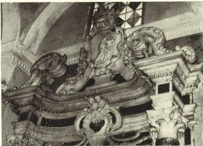
Novi: Lo stemma dei PP. Somaschi sull'altare della Madonna di Loreto, già nel Collegio di S. Giorgio, ora nella Cattedrale.

Essi poi si volsero a farmi ancora particolarissime istanze (ora che veggono sprovvisto quel nostro collegio di un buon preside o