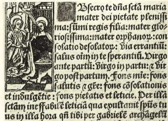
Preghiera « Obsecro te Domina »

E' una raccolta delle principali preghiere (Pater noster, Ave Maria, Credo, invocazione alla S. Croce, Miserere, Salve Regina) precedute dall'alfabeto, compilata per uso di Massimiliano Sforza figlio di Ludovico il Moro: uno dei soliti libri per la prima formazione intellettuale e spirituale di un ragazzino, il quale doveva imparare a leggere su questo sillabario di contenuto dottrinale; per questo la scrittura è molto ampia, e pedagogicamente il testo è accompagnato da vignette e anche da distici sentenziosi. I milanesi lo chiamavano il libretto dello Iesus , perché avanti il Pater noster