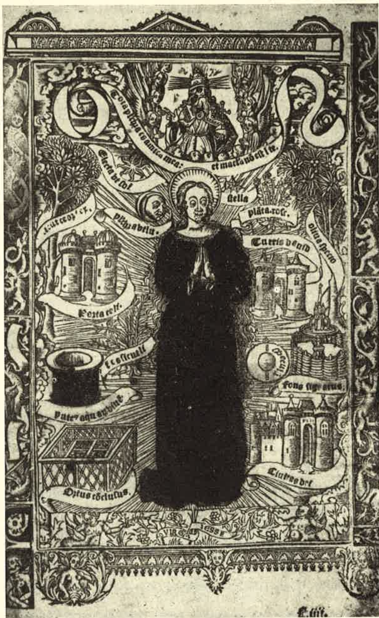
Codice della Trivulziana di Milano. B-93.