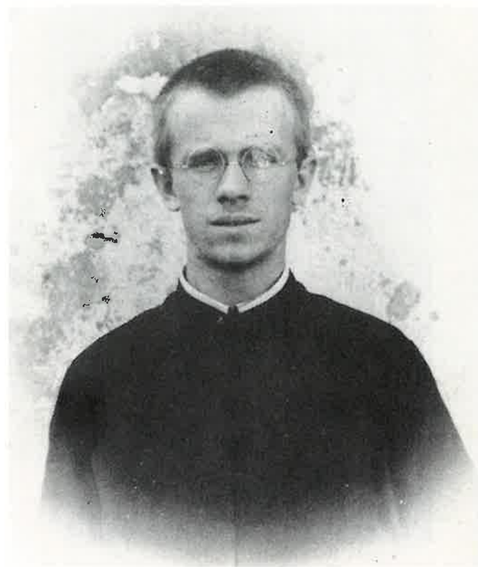
Studente in teologia nel 1930.

Le sue spoglie riposano nel piccolo cimitero del Santuario alla Valletta di Somasca (LC).