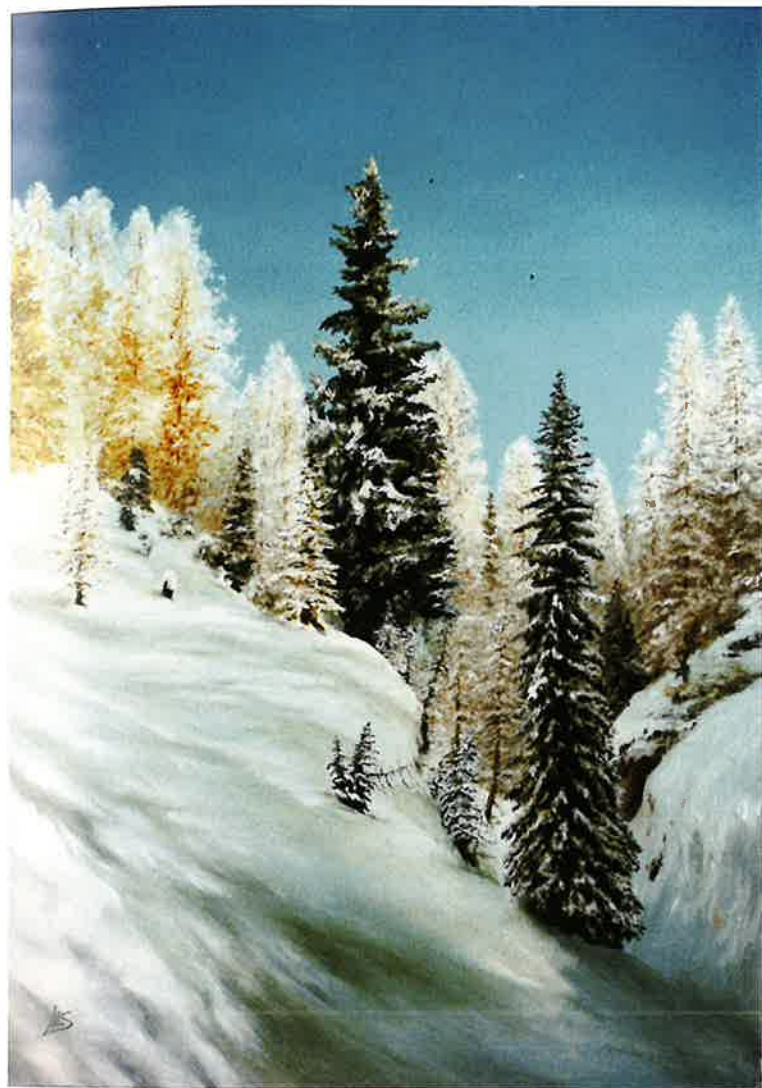
Serafino Albonico Nevicata in montagna olio su tela 50 x 70 cm